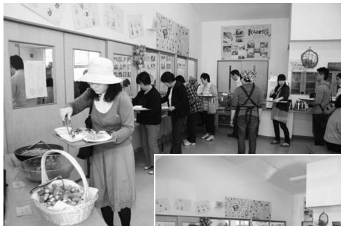
手・まめ・館では、地元の食材を使ったバイキングを開催。訪れた人たちは、食堂に並んだ春の味覚に舌鼓みを打ちました。