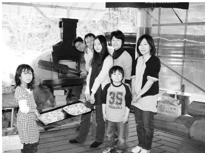
あぶくまエヌエスネットでは、石窯を使ってピザ焼き体験を実施。参加者は、思い思いにピザの生地にトッピングをし、焼きたてのピザをほおぼっていました。