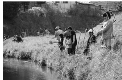
鮫川本流(赤坂東野字広畑)では、ヤマメ釣り天狗好楽会が行われ、大勢の参加者が釣り糸を垂らし、魚とのかけひきを楽しんでいました。