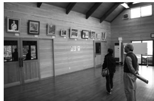
ほっとはうす・さめがわでは、アクリル画作品展を開催。アクリル画愛好会会員が描いた見事な作品に見入っていました。