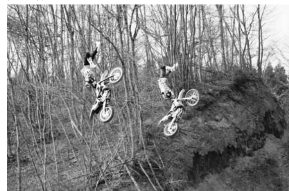
モトパーク森(赤坂東野字遠ヶ竜)では、全国のトップライダーが空中で華麗な技を繰り広げるFMXinさめがわを開催。会場には村内外から大勢の観客が訪れ、大技が決まるたびに大きな歓声が沸き上がりました。