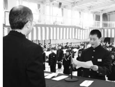
写真上…石山青生野小学校長から教科書を受け取る青生野小の1年生/下…新入生誓いのことば(鮫川中)