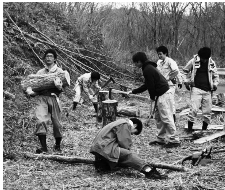
薪割りなどを体験する学生ら

東京農業大学の景観保全活動は四月二十四日、二十五日の二日間、赤坂東野字葉貫地内で行われました。