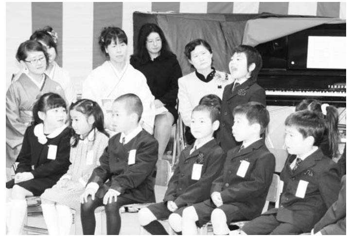
村内小・中学校の入学式は、四月六日に各校の体育館で行われ