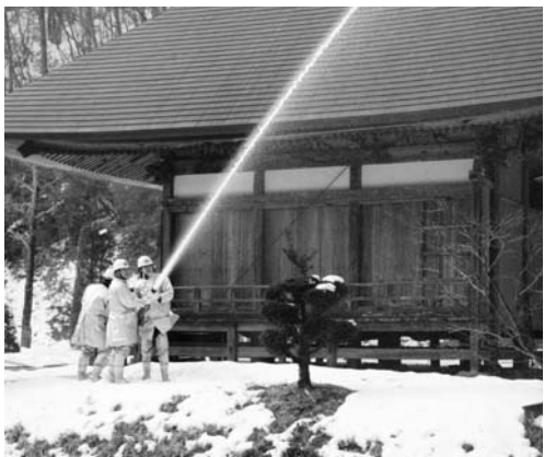
訓練が行われた富田薬師堂

文化財防火デー火災防衛訓練は一月十八日、富田字彦次郎地内の富田薬師堂で行われました。棚倉消防署鮫川分署や村消防団員など関係者約五十人が参加しました。訓練は「富田薬師堂付近から出火した」との想定で行われ、防災無線運用や中継送水訓練、消火防衛訓練が繰り返し行われました。参加者らは万が一に備えて真剣な表情で訓練に励みました。