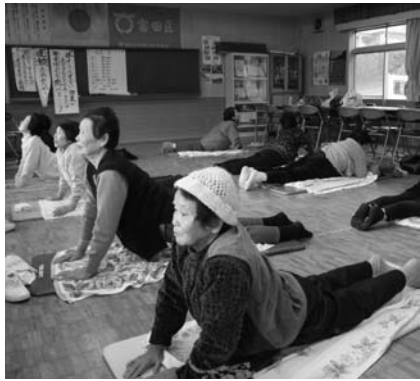
健康運動を楽しむ参加者

健康運動サポーター富田地区の自主活動「みんなの体操会」が、一年を通して富田区集落センターで行われました。最後の教室となった昨年十二月二十日には、一年間を振り返り、今後も体操を続けていくことを誓いました。参加者からは「二年間休まずに続けて運動ができた」「自分たちに合わせて運動をやってくれた」「体がスムーズに動くようになった」「毎回の運動の日が楽しみだった」など健康運動サポーターや村へ感謝の言葉がありました。