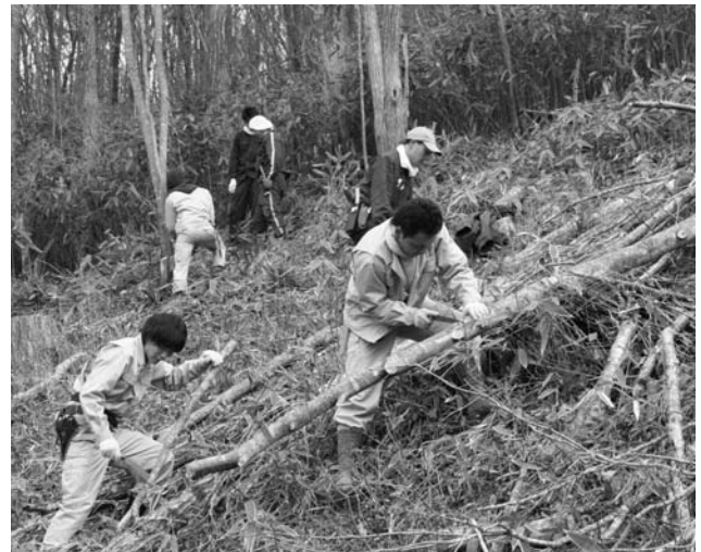
景観保全活動に汗を流す学生ら

東京農業大学短期学部の第五十五回里山景観保全活動は、昨年十二月二十日、二十一日の二日間、葉貴地内で行われました。同活動には、首都圏の住民や東京農大生など三十八人が参加