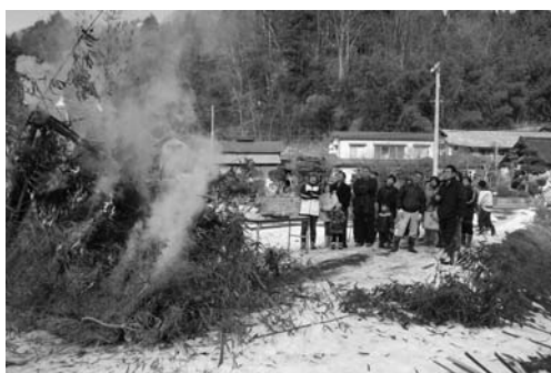
無病息災を祈願した「どんと焼き」

西山・落合地区の小正月行事「どんと焼き」は一月十八日、落合地内で行われました。地元の子どもたちやお年寄りなど約四十人が参加。各家庭から正月飾りなどを持ち寄り、笹竹などで作った小屋に納め供養しました。また、子どもたちは竹の先に刺した餅を焼いて食べ、今年一年の無病息災を祈願しました。