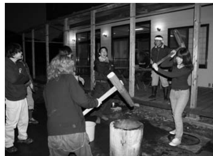
餅つきを楽しむ参加者

初日は、炭焼きに使うための木の伐採作業をノコギリやナタなどを使って行いました。その後、同活動で育てたもち米を使い、杵と臼で餅つきを楽しみました。夜には、懇親会も行われ、里山の郷土料理を味わいながら、地域の人たちと交流を深めました。二日目は、葉貴地区の住民と共同でアカマツ林の間伐作業に汗を流しました。