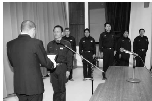
上…通常点検を受ける幹部団員/下…無火災分団の表彰を受ける各分団長

平成二十一年鮫川村消防団出初め式は一月四日、村公民館で行われ、一年間の無火災を祈願しました。式に先立ち、消防車両による村内分列行進で火災予防を呼びかけたあと、通常点検と水勢披露が行われました。式には、幹部団員や来賓など約百五十人が出席。無火災祈願の黙とう、団長式辞、村長あいさつに続き、無火災分団（建物火災が三年以上発生していない分団）と優良団員に表彰状が贈られました。