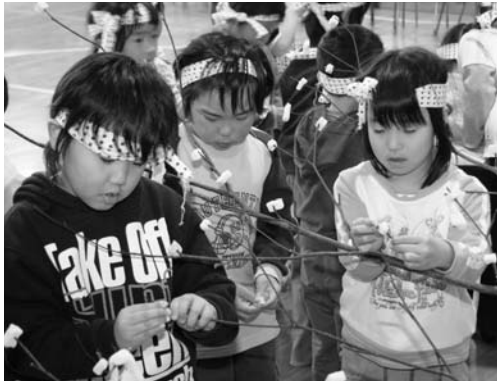
きれいにだんごを飾り付ける子どもたち