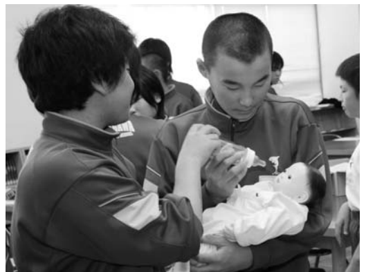
人形の赤ちゃんを使って学ぶ生徒たち

中学一年生対象の思春期ふれあい体験学習は十月八日、鮫川中学校で行われ、出産や育児などについて学習しました。学習では、「生命の誕生」をテーマに、受精のしくみや胎児の成長などを学習したあと、妊婦体験ジャケツトを装着。日常生活の動作体験や、赤ちゃんの人形を使って抱き方などを体験しました。また、妊娠中のお母さんから喜びや不安などのインタビューを行いました。