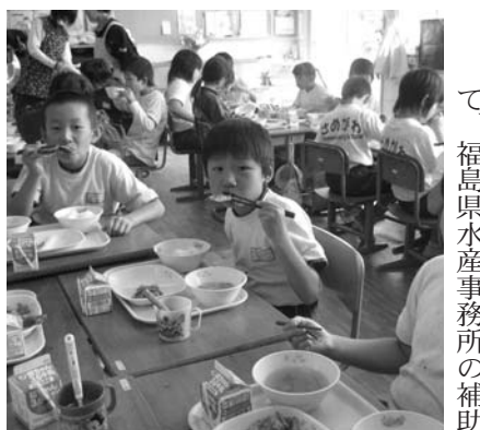
おいしそうに給食をほおぼる児童

学校給食センターでは、水産物の地産地消の推進を目的として、福島県水産事務所の補助を受けて「水産物学校給食推進事業」に取り組んでいます。この事業では、県内で水揚げされたメヒカリやサンマ、サケなどを使用し、学校給食の充実を図っています。九月には、いわきの魚「メヒカリ」を使った「メヒカリの甘酢ソース」、十月には、いわき沖で水揚げされた旬のサンマを使った「さんまの蒲焼き」が給食のメニューとして登場。児童たちは、県内産の魚を身近に感じながら、おいしそうにほおぼっていました。