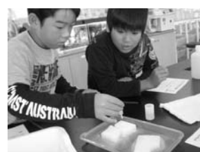
(文・写真 青生野小学校)

福島空港公園でお昼を食べ、その後、空港ターミナルビルの展望台から飛行機の発着を見学しました。特に、中国・上海からの到着便を目の当たりにすることができ、子どもたちは大喜びでした。