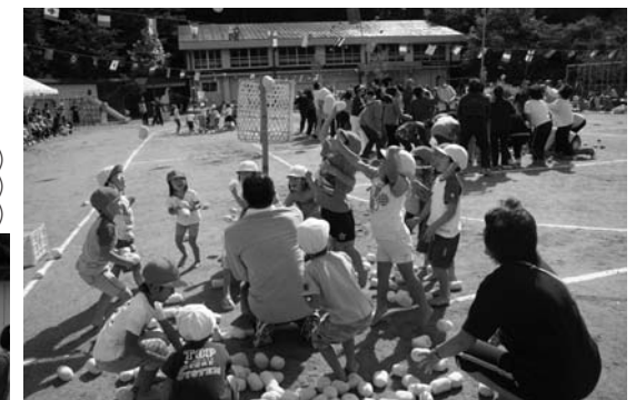
右上/玉入れ (4・5歳児と祖父母) 右下/おむすびコロリンストントン (コスモス組) 左/大地をけてっよーいどん!! (4・5歳児)

こどもセンターの親子運動会は、秋晴れとなった九月二十七日、同センター園庭で行われました。 競技(演技)に先立ち開会式が行われ、角田順子園長、須藤重晴保護者会長のあいさつに続いて、来賓が祝辞を述べました。 競技(演技)では、全員でラジオ体操を行った後、玉入れや紅白リレー、障害物競走などのおなじみの種目のほか、クラスごとに工夫を凝らした種目を次々と子どもたちが披露。保護者の声援を受けながら元気いっぱい園庭を駆け回っていました。 また、小学生やお年寄りなども競技に参加し、楽しいひとときを過ごしました。