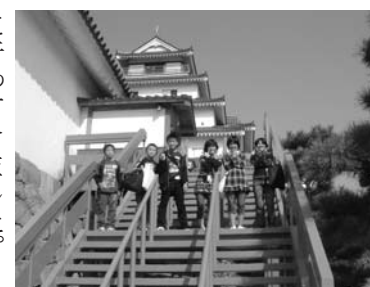
十月十日から五日の日程で、鮫川小学校の六年生と合同で会津若松方面へ修学旅行