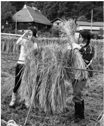
稲刈りを体験する参加者

NPO法人ふるさと回帰支援センターと村が主催する「さがわ・ふるさと体験学校」は十月十八日・十九日の二日間行われました。体験学校は、ふるさと暮らしを希望する人たちが、地域の決まりごとや農作業の仕方などを学ぼうと行われている事業で、今回は十三名が参加。初日は、西山落合地区で、五月に同校の参加者が植えた田の稲刈りを行いました。参加者は、鎌を使って一株ずつ丁寧に刈り取り「はせがけ」にしました。また二日目には、うまいもの祭りにも参加。丸太早切り競技にも出場し、大会を盛り上げました。