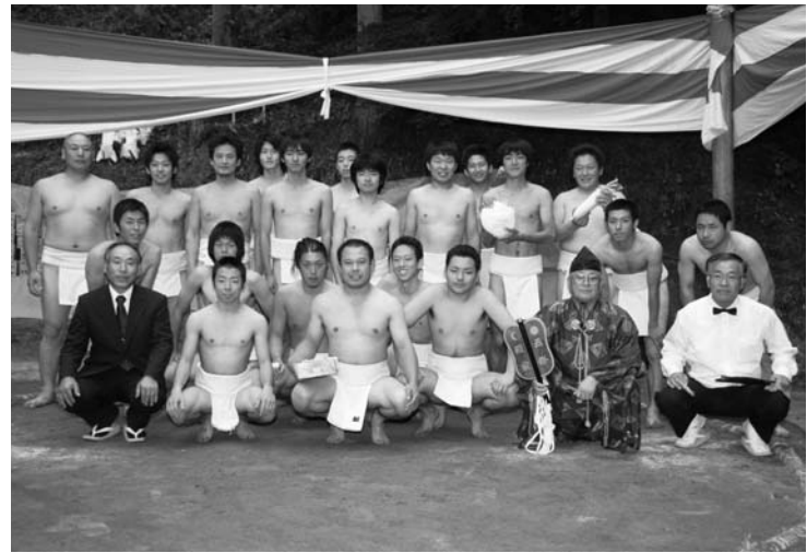
大会を盛り上げた力士と関係者ら

赤坂西野区秋季祭礼の恒例行事「ふるさと相撲大会」は十月五日、名下地内の熊野神社境内で開かれました。