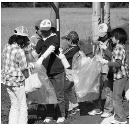
道路沿いのごみを集める子どもたち

村防犯協会と村公民館事業チャレンジスクールの道路クリーンアップは十月十八日、村内各地で行われました。村防犯協会と村教育委員会の主催。関係者と村内の小中学生約百人が参加しました。作業は、道路沿いなどに投げ捨てられた燃えるごみや空き缶、ペットボトルなどのごみ拾いを約一時間半かけて行い村内をきれいにしました。終了後には、鹿角平観光牧場でバーベキューが行われ、参加者は交流を深めました。