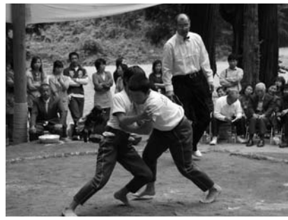
大人に負けない好勝負を見せた「ちびっこ相撲」

大会には村内外から二十人の力士が参加。今年も里山景観保全活動で村を訪れていた東京農業大 学生や小学生も参加し、大会を盛り上げました。 競技では、連続で勝ち抜くまで続く「飛び三人抜き」をはじめ、西野区の小学生による「ちびっこ相撲」、「初切相撲」、「役相撲五人抜き」などが次々と披露され、力強い力士の取り組みに大きな歓声が上がりました。 また、前日にはこどもセンター園庭で豊年踊りも行われ、大勢の人で賑わいました。