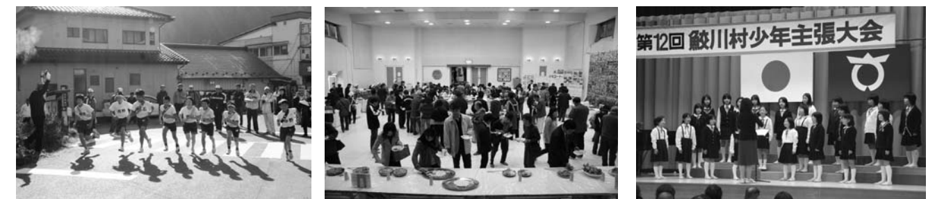
昨年の文化祭行事(左から村民駅伝競走大会、郷土料理を楽しむ会、音楽発表会)