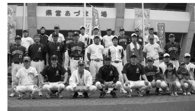
大会に参加した選手たち