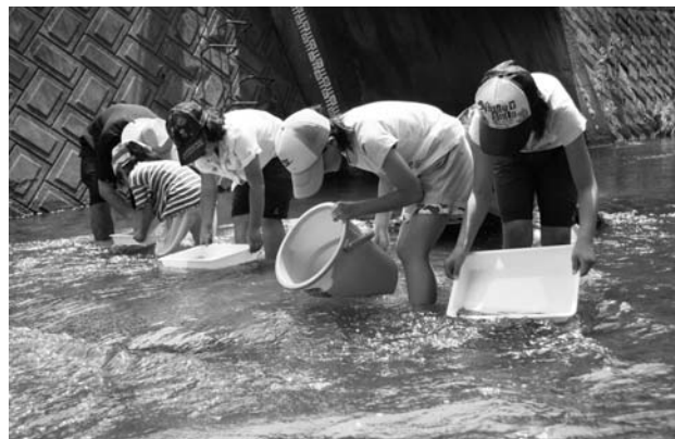
上…水生昆虫を観察する子どもたち/下…カジカの放流