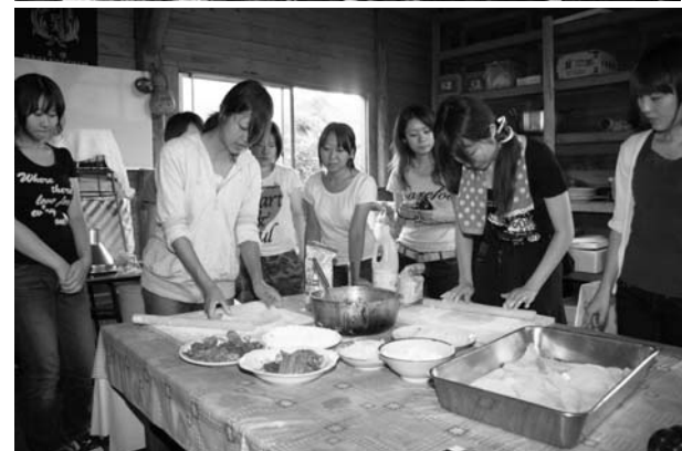
上…里山での学習/下…ピザ焼き体験をする学生

したり、森林の役割や農村の現状などについて学習会を行いました。また、収穫した野菜を使った昼食づくりや石窯ピザ焼き体験、二日目の夜には、肝だめしなどを楽しみました。