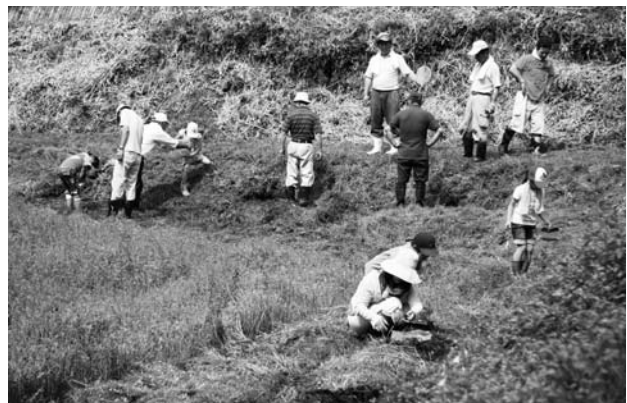
上…笹舟の作り方を教えてもらう子どもたち/下…休耕田の水路を調べる参加者