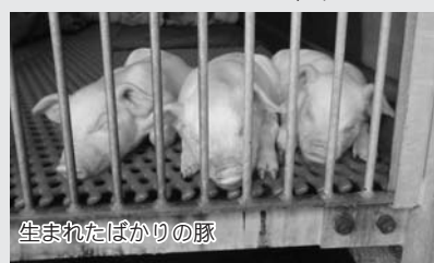
生まれたばかりの豚