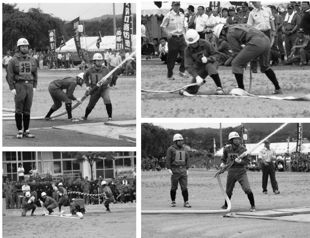
競技に望む選手（上…第5分団、下…第2分団）

「第三十六回福島県消防操法東白川支部大会」は七月二十七日、塙小学校校庭で行われました。