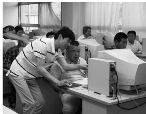
パソコンの操作を学ぶ参加者

村公民館主催の「IT講習会・ワード(ワープロソフト)講座」は、六月二十四日から二十七日まで鮫川中学校コンピュータ室で行われました。デジタルフォース鮫川の会員が講師となり、九人が参加。参加者らは、パソコンの基本操作を身につけようと、真剣な表情で画面に向かっていました。また、八月には「エクセル(表計算)講座」が行われる予定です。