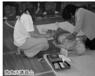
救急法講習会 が一部 か た う も み ん に 組 い ま し

七月四日授業参観後、「救急法講習会」を実施いたしました。鮫川消防署員の方々に講師としてお招きし、夏休み中のプール指導における方が一の場合や家庭で救急法が急に必要になった時に役立つように、AEDの使用方法も含めて、人体模型を使っての実技演習を行いました。ほとんどの方は、講習会を一度は経験しているとのことでしたが、心肺蘇生法の方法