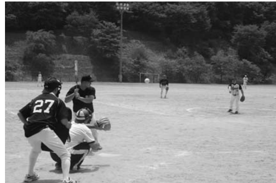
上…9人制バレーボール(農業者トレーニングセンター)/下…ソフトボール青年の部(青少年広場)

村健康づくり夏季球技大会の成績は次のとおりです。 【ソフトボール】▼青年の部：①サンライズ(東石)／②西山スターズ(西山)／③西野ヤンキース(西野)▼壮年の部：①西山球友(西山)／②渡瀬(渡瀬)／③東石(東石)▼OBの部：①中野ナイスエージ(中野)／②西野OB(西野)／③西山OB(西山) 【バレーボール】▼家庭バレーボール：①渡瀬(渡瀬)▼9人制バレーボール：①西山レディース(西山)／②西野(西野)／中野VBC(中野)