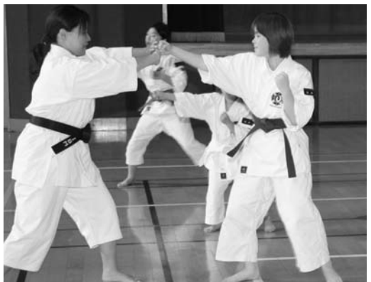
練習を行う拳士たち

今年で十回目となった少林寺拳法鮫川支部の合同合宿は七月十九日・二十日の二日間、村農業者トレーニングセンターで行われました。各支部の教えや拳士たちの交流を目的として、鮫川支部や東京都、石川県の拳士ら四十人が参加。両日とも練習で汗を流し、交流を深めました。また、初日の夜には、山王の里で懇親会が行われ、楽しいひとときを過ごしました。