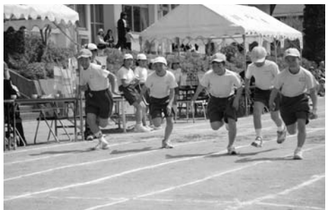
鮫川小学校運動会 / 上…明日にかけの橋 (3・4年生) / 下…150メートル走 (6年生)

また、青生野小は五月二十五日に開催。あいにくの雨となり、同校体育館での実施となりました。館内では、玉入れや綱引きなど子どもたちによる競技のほか、消防団や婦人会などの種目も多数披露され、参加者は声援を受けながら元気いっぱい会場を駆け回っていました。