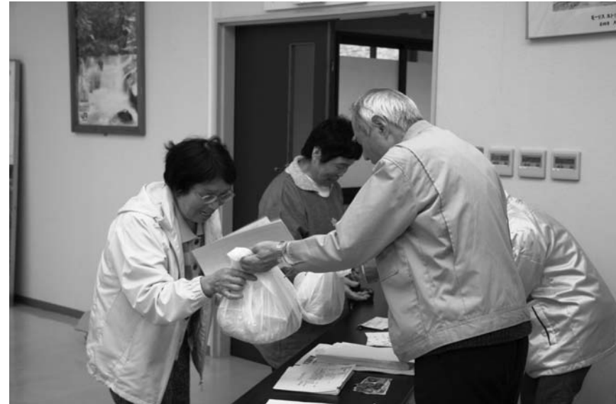
栽培面積に応じて大豆などの種が配られました

農業の振興と高齢者の生きがい・健康づくり、特産品の開発を目的に村が進める「豆で達者な村づくり」事業も五年目を迎え、今年栽培する種子の配布が五月十四日、各地区の集落センターなどで行われました。