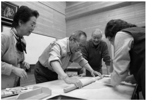
そば打ち体験をする参加者

東京鮫川会の「ふるさと探訪ツアー」は五月十日・十一日の二日間、「ほっとはうす・さめがわ」などで行われました。首都圏在住の会員など三十人が参加。初日は、鹿角平観光牧場でバーベキューや野菜採りなどを楽しみました。二日目は、村農村体験交流施設「山王の里」で絞ったての牛乳を味わい、景勝地を巡り、ふるさとの魅力を再発見しました。また、館山公園へ桜の苗木を植樹しました。