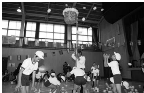
青生野小学校運動会 / 上…ぼくらのリサイクル (3・4年生) / 下…全校玉入れ