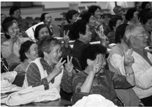
健康運動を行う参加者

高齢者の生きがいづくりを目的とする村公民館主催の社会学級が五月二十日に開級し、今年度は百六十四人が参加します。講座は、創作活動や自主学習を地区ごとに実施。一年間の学習の成果を文集「里の春」にまとめます。この日は併せて第一講座も行われ、後期高齢者医療制度について学びました。その後、指や肩などの筋肉を伸ばす健康運動で元気に体を動かしました。