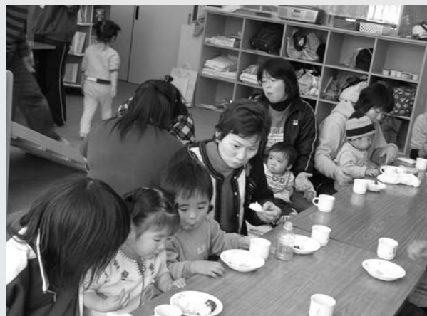
やまゆり保育室より