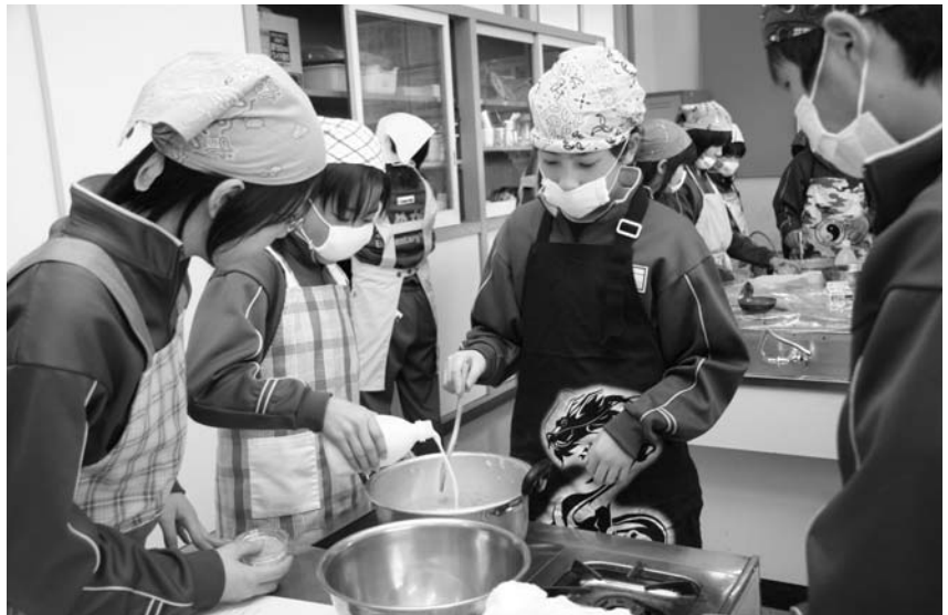
豆乳プリンを作る子どもたち

鮫川小六年生四十一人が一年を通して栽培・収穫を体験し、食への大切さや生産者の気持ちを考え、今後の生活に役立てることが目的。実習では、豆乳を使った「豆腐プリン」や「豆乳・おから・じゅうねんクッキー」を調理しました。焼きあがったクッキーを食べ、子どもたちは「うまい!」などの感想を述べ、実習を通して食の大切さを学びました。