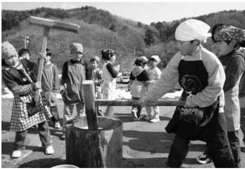
一生懸命もちつきをする子どもたち

村公民館事業「チャレンジスクール」第八講座および閉校式は二月二十三日、村公民館で行われました。小学生約四十人が参加。講座では、中野長生会の会員が協力し、臼と杵を使ってもちつきを楽しみました。子どもたちは、ついたもちを思い思いに丸め、あんこもちやきな粉もちにして味わいました。引き続き閉校式が行われ、一年間の活動を振り返りました。