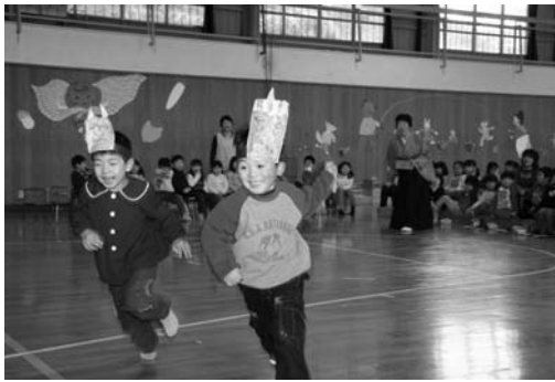
鬼を追い払ってもらう園児

さめがわこどもセンターの豆まきは二月一日、こどもセンターで行われました。こどもセンターの園児百三十七人が参加しました。園児一人ひとりが「ふざける鬼」「泣きむし鬼」「話し聞かない鬼」など自分の中にいる鬼を發表し、青砥園長先生に追い払ってもらいました。その後、年の数だけ豆を食べて、こどもセンターの各教室を園児全員で豆まきをしました。