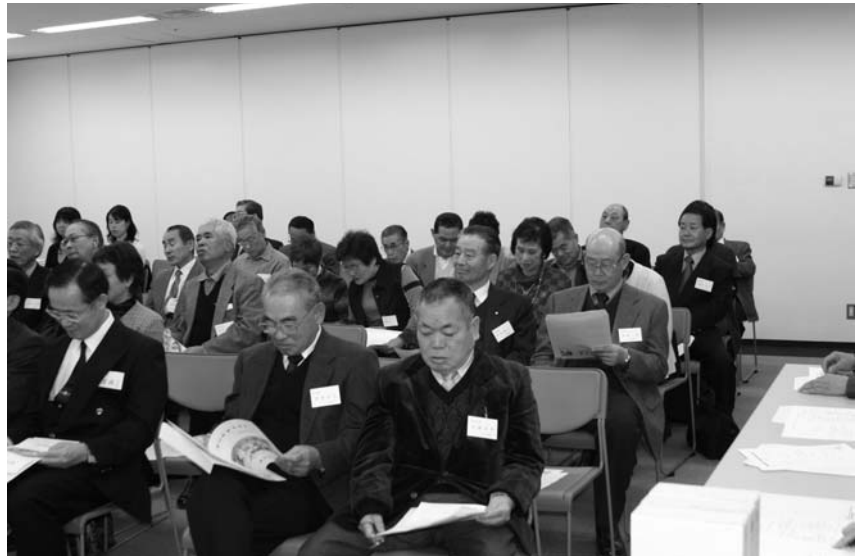
大勢の会員が出席した総会