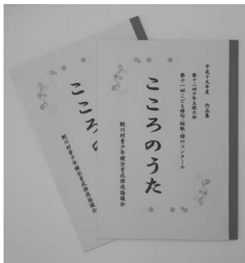
子どもたちの作品をまとめた「こころのうた」