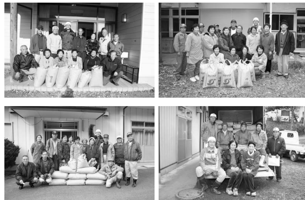
大豆と小豆の集荷作業に参加したみなさん(右上から、中野・東石地区、富田地区。左上から西野地区、西山地区)

大豆・小豆の集荷作業は、昨年十二月十一日・十二日の二日間、各地区の集落センターなどで行われました。