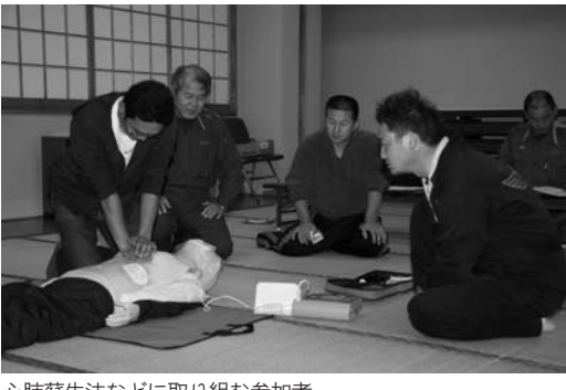
心肺蘇生法などに取り組む参加者

村公民館事業「ユースカレッジ」第三講座は十月十五日、公民館で行われました。 今回のユースカレッジは、榎倉消防署鮫川分署員が講師となり、救急車がくるまでの応急手当の基礎知識やAED（自動体外式除細動器）の使用、心肺蘇生法の流れなどを学びました。 講習では、参加者ひとりひとりが、心肺蘇生法などを体験し、万が一に備えて熱心に取り組んでいました。