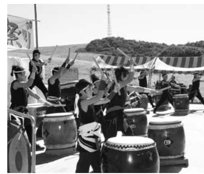
右上/動物ふれあい広場 右下/バーベキューに舌鼓 左/高原YOSAKOI