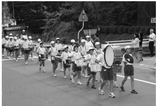
交通安全パレードで演奏する児童たち

秋の全国交通安全運動期間中の九月二十六日、村交通対策協議会と交通安全協会鮫川支部共催の「交通安全鼓笛パレード」が行われました。 村内の交通関係団体のメンバーらが参加し、横断幕を先頭に鮫川小と青生野小児童鼓笛隊の演奏に合わせて、赤坂東野字広畑地内（国道三四九号鮫川バイパス）から鮫川小校庭までの区間を行進。沿道の村民に交通安全を呼びかけていました。