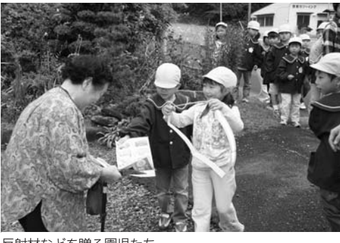
反射材などを贈る園児たち

さがわこどもセンターの交通安全教室は十月十七日、宿ノ入交差点で行われました。 保育園児と幼稚園児の七十二人が参加。はじめに交差点での横断歩道の渡り方を学び、お年寄り宅を訪問。園児が「交通事故に気をつけて」と声を掛け、反射材を贈りました。その後、園児らは、白バイ隊員の仕事をなどを聞き、バイクにまたがったりして歓声をあげていました。