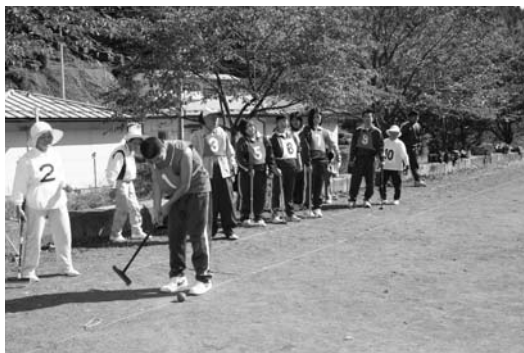
競技を楽しむ参加者

第十九回老人クラブと東白川農商高校鮫川分校生とのふれあいゲートボール大会は十月十日、さざり荘ゲートボール場で行われました。 老人クラブ会員と鮫川分校生が交流を図り、健康づくりと体力の維持向上が目的。約六十人が参加し、老人クラブ会員と分校生との混合チームで競技が行われました。 参加者は、競技を通して交流を深めていました。