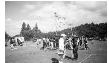
地域の催しの案内、仲間づくりの呼びかけなど、掲載希望記事を募集しています。

た。参加者は競技を通して親睦を深めていました。