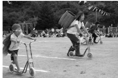
上/玉入れ(4・5歳児と祖父母) 左/ゴーストマンとしょういかごマン(さくら組・親子)