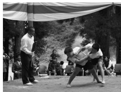
上/大会を盛り上げた力士と関係者ら 左/大人に負けない好勝負を見せた「ちびっこ相撲」