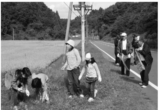
道路沿いのごみを集める参加者

村防犯協会と村公民館事業チャレンジスクールの合同道路クリーンアップは十月十三日、村内各所で行われました。 村防犯協会関係者や村内の小中学生八十人が参加。道路沿いの側溝などに投げ捨てられた燃えるごみや空き缶、ペットボトルなどを分別しながら回収し、終了後には、鹿角平観光牧場でバーベキューが行われました。