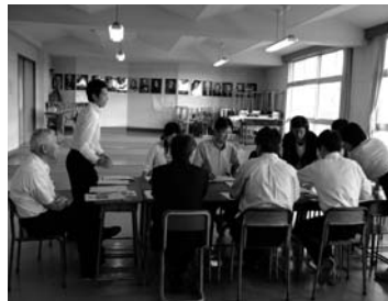
(文・写真 鮫川中学校)

『生徒一人一人に確かな学力を身につけさせる授業はどう行えばよいか』をテーマに、九月十八日に本校で授業と研究会を行いました。一年生で数学、二年生で国語、三年生で社会の授業を行いました。生徒たちは、課題に対し真剣に取り組み、自分の考えをまとめしっかりと発表することができました。