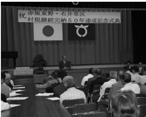
村税継続完納50年を祝った記念式典

八月二十八日に村保健センターで実施した三歳児健診で、むし歯がなかったお子さんは、受診十人中七人でした(写真)。次回の三歳児健診は、十一月二十日火の予定です。