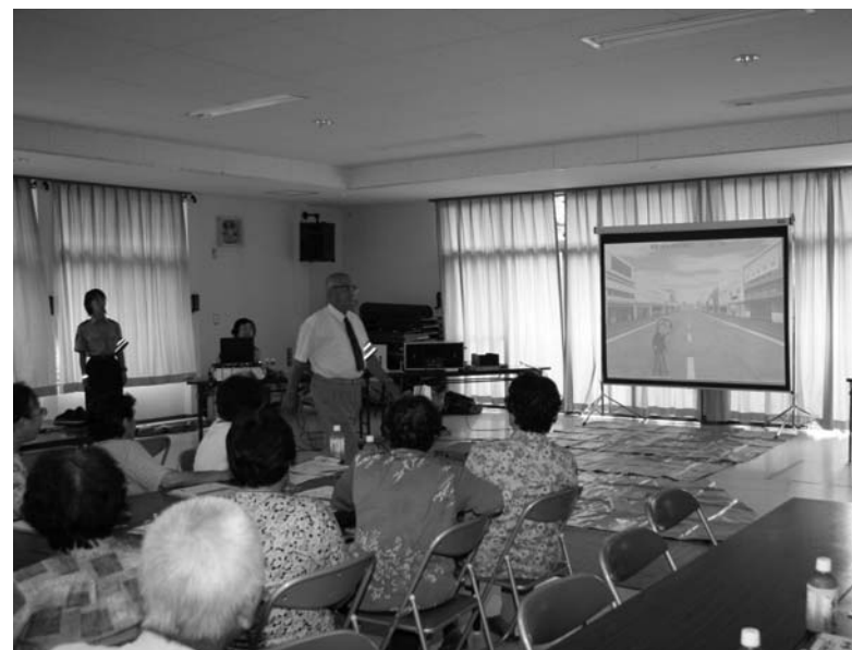
高齢歩行者教育システムを使って行われた第1回講習

高齢者交通安全大学開校式は八月二十八日、赤坂西野区民センターで行われました。開校式には、赤坂西野区の社会学級受講者や棚倉地区交通安全協会高齢者支部鮫川分会の約四十人が参加。さまざまな交通手段に対応できる知識をつけてもらい、交通事故をなくすことを目的として全四回の講座を予定しています。