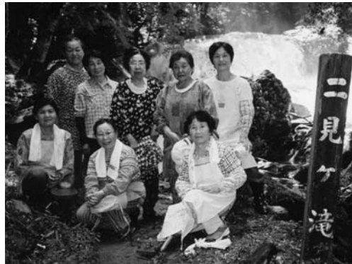
清掃作業に参加した参加者