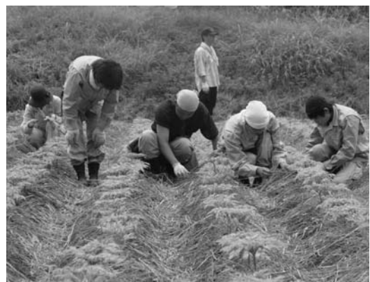
こんにやく畑の除草をする参加者

四十七回目となる東京農業大学の里山景観保全活動は七月七日・八日の両日行われ、約四十人が参加しました。