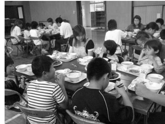
(文・写真 青生野小学校)

七月六日、保護者の方を招いてふれあい給食試食会が開かれました。昨冬に、地域の方々から教えていただきましたが、子どもたちが作った「しみもち」を保護者の方が調理してくださり、みんなでおいしくいただきました。昔から伝わる郷土料理にみんな大喜びでした。