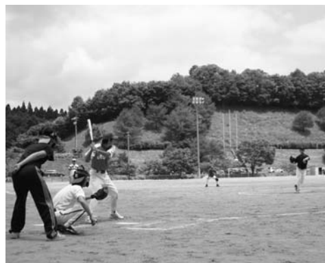
上…9人制バレーボール(農業者トレーニングセンター)/下…ソフトボール青年の部(青少年広場)