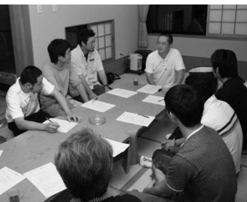
熱心に話を聞く参加者

村公民館事業「ユースカレッジ」第二講座は七月二十一日、きつねうち温泉（白河市東釜子）で行われました。