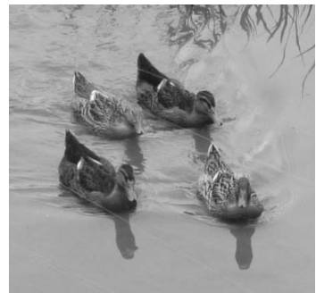
有機栽培で活躍するアイガモ

鮫川小五年生と青生野小五・六年生を対象とした学校給食米栽培田見学は七月十二日、西山字戸倉地内の水田で行われました。この学習は、子どもたちが給食で食べている米について農家から直接栽培方法などの話を聞き、食の大切さを学ぶことを目的に