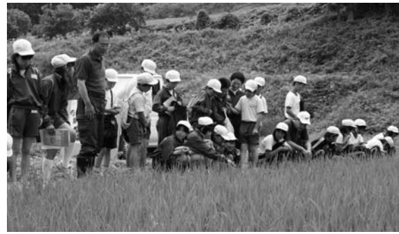
水田を見学する児童たち

鮫川小五年生と青生野小五・六年生を対象とした学校給食米栽培田見学は七月十二日、西山字戸倉地内の水田で行われました。この学習は、子どもたちが給食で食べている米について農家から直接栽培方法などの話を聞き、食の大切さを学ぶことを目的に