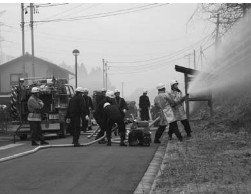
防衛訓練を行う消防団員ら

平成十九年春全国火災予防運動に伴う火災防衛訓練は、三月四日、赤坂西野字茅地内（見渡団地）で行われました。訓練は、「団地付近の道路脇より出火し、住宅にも延焼の恐れあり」との想定で、棚倉消防署鮫川分署と村消防団による防衛訓練が繰り広げられました。また、訓練終了後には、地域住民による消火器の取扱講習会が行われ、参加者は真剣に取り組んでいました。