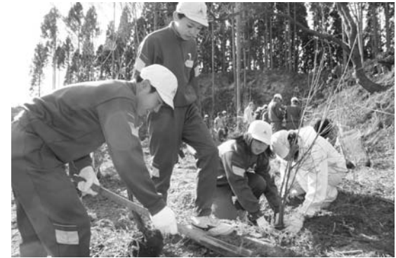
上・下…公園の整備と記念植樹を行う中学生

業です。完成の暁には、四季の花が乱れ咲き、村民のやすらぎとふれあいの憩いの公園として末永く続くことを願っています。ボランティアのみなさんに感謝申し上げます。」とあいさつしました。作業は、あいにくの雨模様の中、ツツジ類やカエデ類、ヤマザクラなどの苗木約千三百三十本を公園内に植