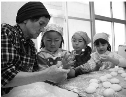
もちの丸め方を教えてもらう子どもたち

村公民館事業「チャレンジスクール」第八講座および閉校式は二月二十四日、村公民館で行われました。小学生約二十五人が参加。講座では、中野長生会の会員が協力し、臼と杵を使ってもちつきを楽しみました。子どもたちは、ついたもちを思い思いに丸め、あんこもちやきな粉もちにして味わいました。引き続き閉校式が行われ、一年間の活動を振り返りました。