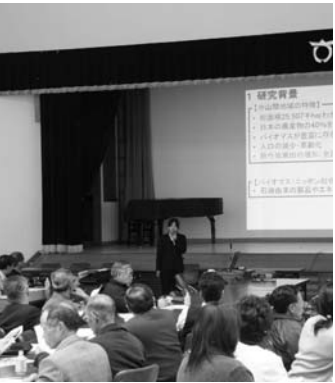
農大生による発表が行われた報告会

東京農大大学の研究成果報告会およびエコファーマー認証式は三月二十二日、村公民館で行われました。