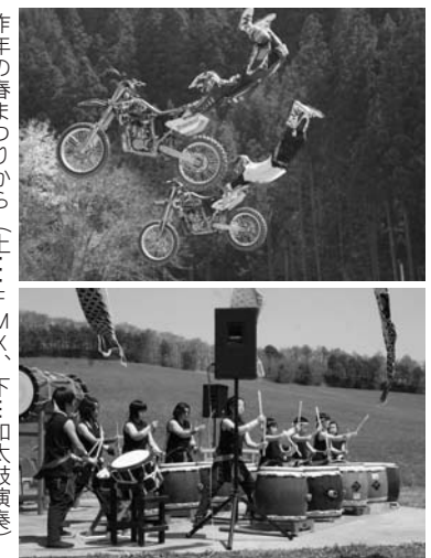
昨年の春まつりから(上...FMX、下...和太鼓演奏)

鹿角平 宇宙のロマンとの出会い 2007(天体観望会) 時間 午後7時30分~午後9時頃 場所 鹿角平天文台(鹿角平観光牧場内) 内容 「惑星を見よう」をテーマに、木星・土星・月などの観望会を行います。 ※天候により中止する場合があります。 料金 無料 主催/鮫川天文愛好会