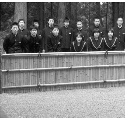
「和みの間」作りに関係した生徒たちと校長先生のワンショット