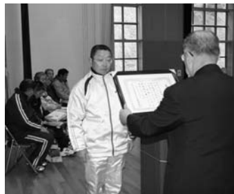
水野会長から表彰を受ける功労賞受賞者