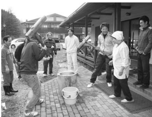
もちつきに挑戦する参加者