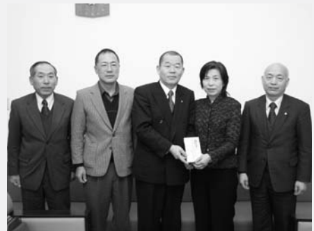
大楽村長に寄付を手渡す実行委員のみなさん

自立の村づくり基金への寄付(2月受理分) ■自然環境の維持、保全及び整備に関する事業…平成19年還暦祝賀実行委員会