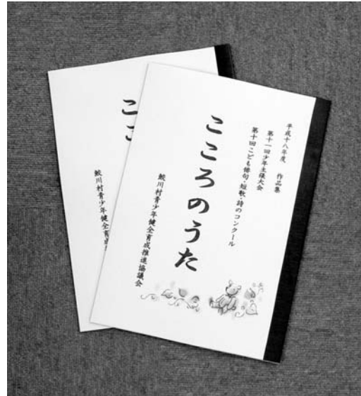
子どもたちの作品をまとめた「こころのうた」