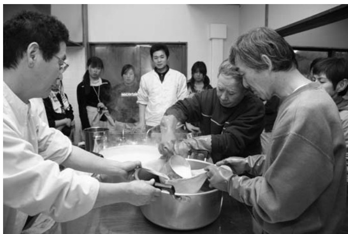
豆腐づくりに挑戦

二日目は、同日行われた館山公園の整備作業に参加。ボランティアで参加した村民と一緒に汗を流し、里山の冬を満喫していました。