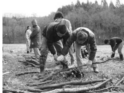
炭焼きに使う枝を切る作業を行う参加者