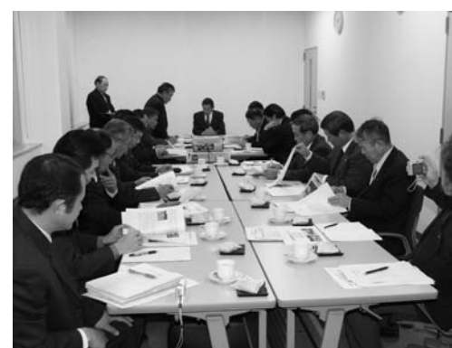
研修に訪れた長野県小川村のみなさん

なお、今回のほかにも視察団が多数来村しており、鮫川村の村づくりが注目を集めています。