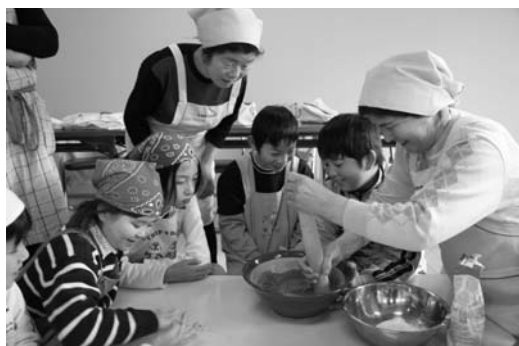
ひまわりの会のみなさんに調理を教してもらう子どもたち