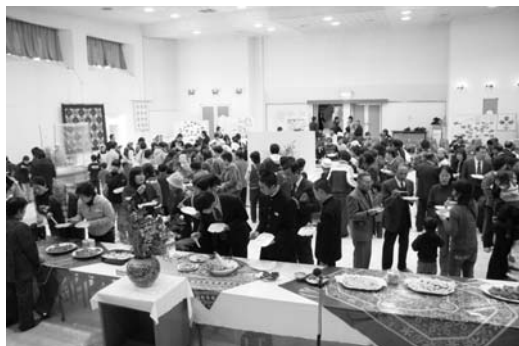
たくさんの人でにぎわう会場内