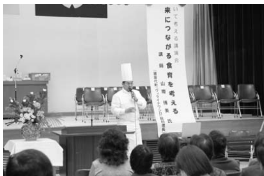
山際総料理長による「食育」についての講演会