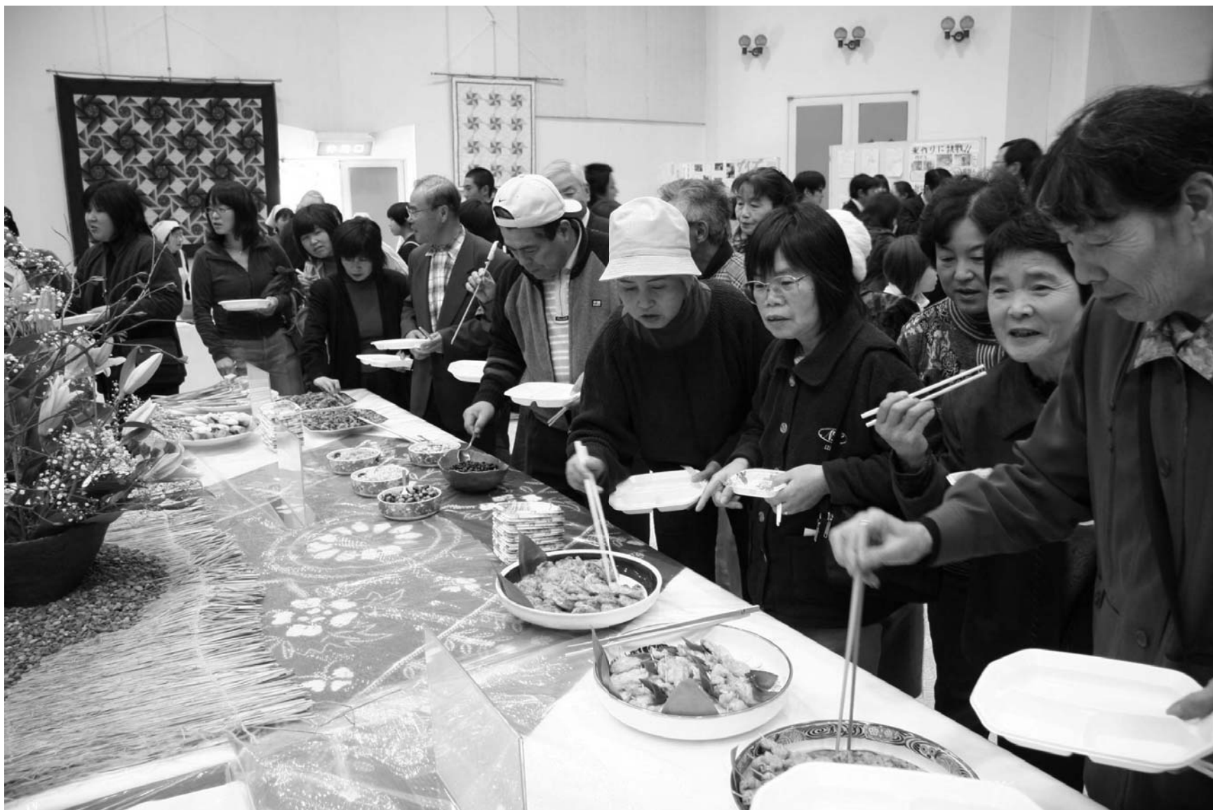
料理に舌鼓を打つ参加者