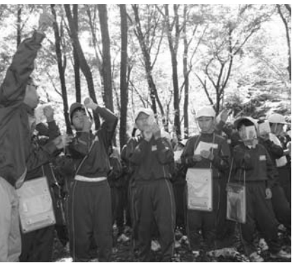
木の高さの測り方に挑戦する児童

今年から始まった森林環境税を活用した森林環境学習は十月二十六日、三十一日の二日間、館山公園などで行われました。