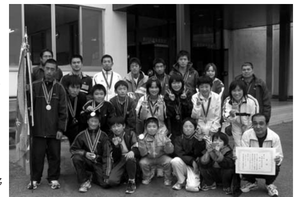
2連覇を果たした西山チーム