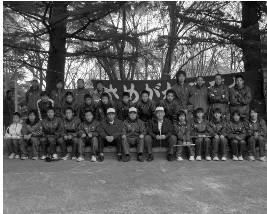
健闘した鮫川村チーム選手団

福島陸上競技協会・福島民報社主催の第十八回市町村対抗福島県縦断駅伝競走大会（ふくしま駅伝）は十一月十九日、白河総合運動公園陸上競技場（白河市）から県庁前（福島市）を結ぶ十六区間（九十六・二キロ）で行われました。