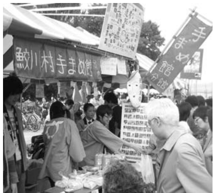
大勢の人に村の魅力をPRした収穫祭

三日から五日まで開かれ、期間中に「手・まめ・館」の商品も販売されました。 即売店は、里山まるごと体験学校（景観保全活動）に参加し、村で農業体験などを行っている農大生が中心となり、「手・まめ・館」の野菜や大豆加工品などを販売。訪れた人たちに村の魅力をPRしました。なお、多数の団体の中から、接客や装飾などが優れた団体が認定される「最優良店」にも選ばれました。