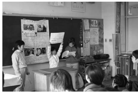
上…青生野小の学習発表会/下…鮫川小のさめっ子フェスティバル

子フェスティバル」は十一月十八日、同校体育館と各教室で行われました。オープニングセレモニーでは、少年の主張大会で発表した児童の発表や学校紹介、合唱部の発表などが行われ全校生で合唱。続いて、各教室に場所を移し、学年ごとに「生き物」や「米づくり」「福祉」などさまざまな分野で学習した成果を元気よく発表しました。 訪れた人たちは、子どもたちの発表に熱心に耳を傾けていました。