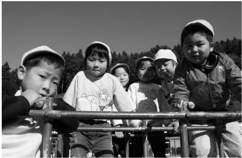
「こどもセンターにおいでよ」

平成19年4月から鮫川幼稚園・鮫川保育園に入園を希望する児童の申し込みを次により受け付けます。