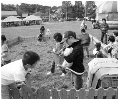
子どもたちに大人気だった動物ふれあい広場

うまいものコーナー、試飲コーナーなどが設けられ、鮫川の「うまいもの」をアピール。また、特設メインステージでは、干し草投げ選手権大会の決勝やスパービンゴゲーム、学法石川高校吹奏楽部による演奏など多彩な催しが次々と繰り広げられ、参加者は思い思いに高原の秋を満喫していました。