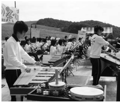
演歌メドレーなどおなじみの曲を演奏し、祭りを盛り上げた学石吹奏楽部