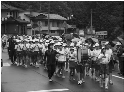
交通安全パレードで演奏する児童たち

秋の全国交通安全運動期間中の九月二十六日、村交通安全協議会と交通安全協会鮫川支部主催の「交通安全鼓笛パレード」が行われました。パレードには村内の交通関係団体のメンバーが参加し、横断幕を先頭に国道三四九号鮫川バイパスをスタート。参加者は、鮫川小までの一・五キロの区間を鮫川小・青生野小児童の演奏に合わせて行進し、沿道の村民に交通安全を呼びかけました。