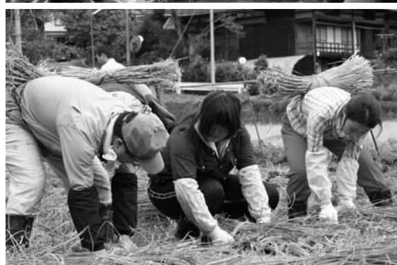
上・稲わらもじりに挑戦する参加者/下・刈り取った稲をしばるのも一苦労