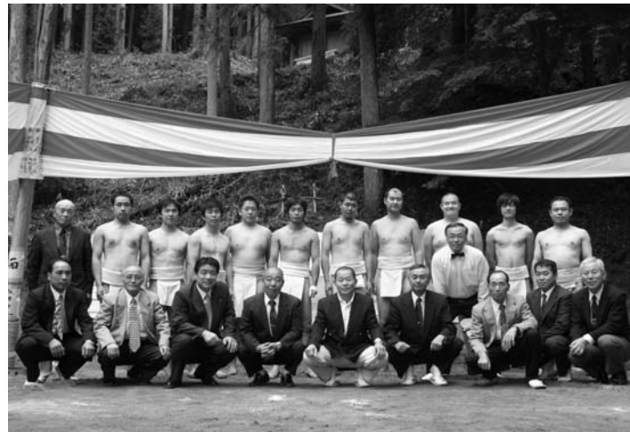
大会を盛り上げた力士と関係者ら

赤坂西野区秋季祭礼の恒例行事「ふるさと相撲大会」は十月一日、名下地内の熊野神社境内で開催されました。