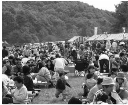
大勢の参加者で賑わう会場内

天候に恵まれた今年のうまいもの祭りには、村内外から家族連れや職場のグループなど約二千五百人が訪れ、イベントやバーベキューなどを楽しみました。会場には、特産品の青空市や