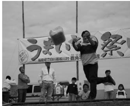
日本新記録も飛び出した第4回全日本干し草投げ選手権大会