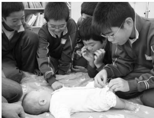
あかちゃんと"ふれあう"子どもたち

小学六年生(鮫川小四十九人、青生野小二人)を対象とした思春期ふれあい体験学習は十月二十六日、村保健センターで行われました。体験学習には七組の乳幼児と保護者が協力。各グループにわかれて、四か月から八か月までの赤ちゃんをだっこしたり、ミルクをあげたりしながら直接ふれあいました。また、お父さんやお母さんに質問し、子育ての苦労や喜びなどを学びました。