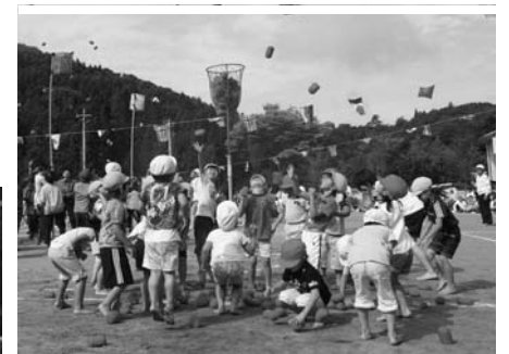
右上/玉入れ (4・5歳児と祖父母) 右下/どうぞ おおがりがください (たんぼほ組・親子) 左/大地をけて よーいどん!! (4・5歳児)

こどもセンターの親子運動会は、秋晴れとなった九月三十日、同センター園庭で行われました。親子運動会は幼稚園・保育園合同で実施。競技(演技)に先立ち開会式が行われ、青砥ハツ子園長、関根靖夫保護者会長のあいさつに続いて、来賓が祝辞を述べました。 競技(演技)では、全員でラジオ体操を行った後、玉入れや紅白リレー、障害物競走などのおなじみの種目のほか、クラスごとに工夫を凝らした種目を次々と披露。子どもたちは、保護者の声援を受けながら元気いっぱい園庭を駆け回っていました。また、小学生やお年寄りなども競技に参加し、楽しひとときを過ごしていました。