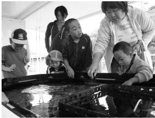
海の生き物に触れる子どもたち

(財)ふくしま海洋科学館(アクアマリンふくしま)主催の移動水族館は十月十四日、村公民館で開かれました。公民館前に駐車された専用車両には色とりどりの熱帯魚が泳ぐ水槽と、ヒトデやウニなどに直接触れることができる水槽が設置され、訪れた子どもたちは大喜び。また、公民館内では海藻の押し葉を使った工作教室や、アザラシなどのはく製の展示もあり、家族連れで賑わいました。