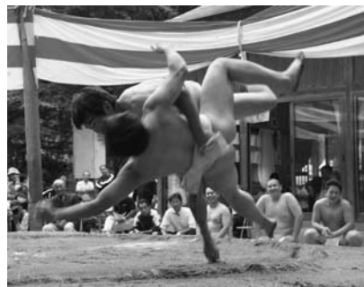
豪快な技が決まるたびに歓声が上がりました

大会には村内外から十人の力士が参加。今回は、里山景観保全活動で村を訪れていた東京農業大学生や小学生も参加し、大会を盛り上げました。 競技では、連続で勝ち抜くまで続く「飛び三人抜き」をはじめ、西野区の小学生による「ちびっこ相撲」、「初切相撲」、「役相撲五人抜き」などが次々と披露され、力強い力士の取り組みに大きな歓声が上がりました。 また、前日にはこどもセンター園庭で豊年踊りも行われ、大勢の人で賑わいました。