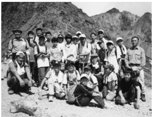
茶臼岳で

西山区区青少年健全育成推進協議会(関根彦孝会長)主催の区民登山は九月十日、那須連山の茶臼岳(栃木県那須町・標高一九一五メートル)で行なわれました。登山には、西山区民三十二人が参加。当日は晴天にも恵まれ、全員が無事頂上まで登ることができました。登山途中には硫黄の匂いも嗅ぐことができ、参加者は茶臼岳山頂から見える関東平野や雲海、那須の自然を満喫しました。