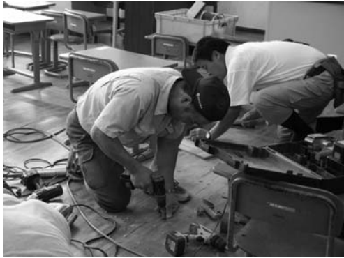
教室の床を修繕する会員

村商工会建設分科会による校舎などの修繕作業は夏休み期間中の八月二十一日、各小学校で行われました。