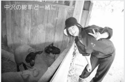
中沢の綿羊と一緒に

手付かずの自然を手付かずのまま残すという自然保護もあるけれど、人間が自然の一部になって、人間が行動し続けることで生態系を維持するという自然の守り方もあるんだなあ。そんなことを、暑い中ジャージ着て、大豆畑の草をぶちぶちむしりながら考えていた夏でした。(文/大草鮎子)