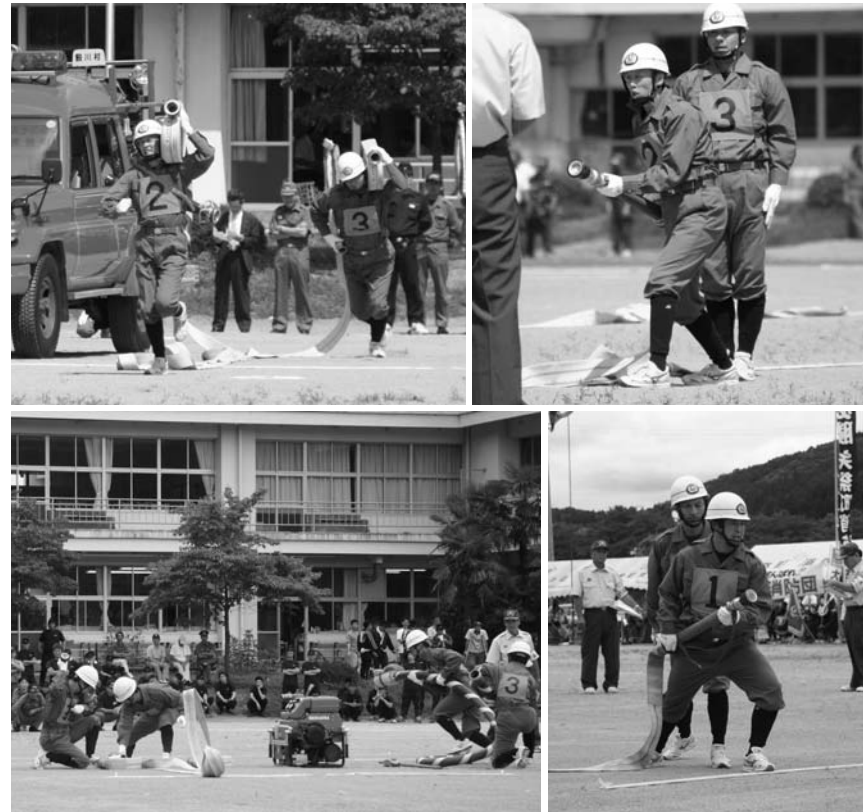
競技に望む選手（上…第1分団、下…第7分団）

の部は棚倉、矢祭、鮫川、塙の順番で競技を行い、技術の正確さや動きの早さを競いました。選手の皆さんは、機敏な動作で競技に臨み、約二カ月間にわたる厳しい訓練の成果を十分に発揮し、観衆から惜しみない拍手が送られていました。