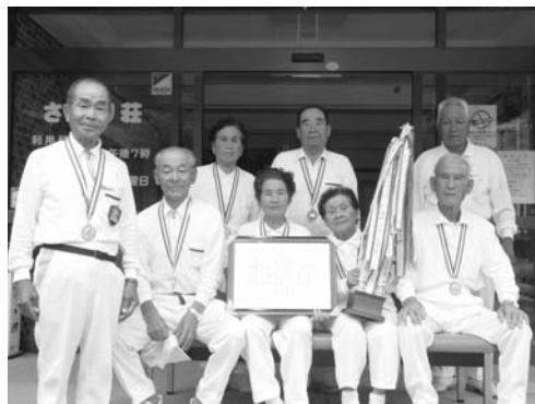
優勝した東石Bチーム

「第二十四回鮫川村老人クラブ連合会ゲートボール大会」は八月四日、さきり荘ゲートボール場で行われ、東石Bチームが熱戦を制しました。