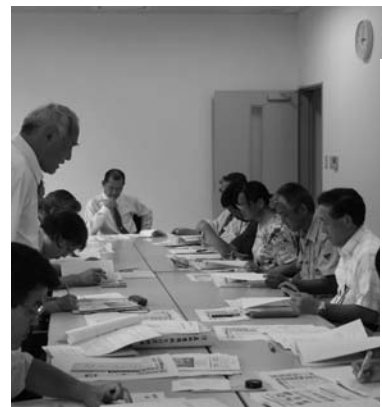
将来の森林づくりについて協議する委員

村「もりづくり1000年委員会」の第一回会議は八月二十二日、役場会議室で行われました。