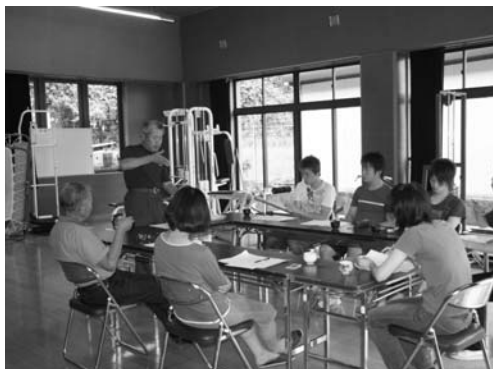
心肺蘇生法などについて学んだ救急講習会

夏休み期間中のプール監視員などを対象とした救急講習会は八月一日、村農業者トレーニングセンターで行われました。