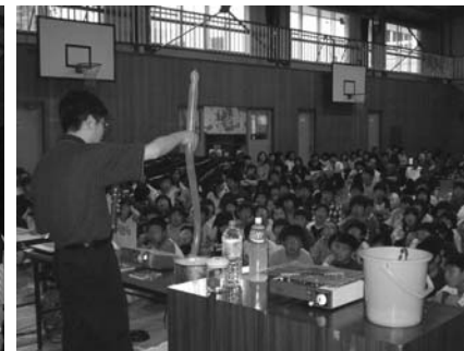
親子サイエンス教室