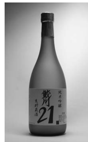
4月29日から販売されている「鮫川21」。 1本（720ミリリットル詰）1,450円（税込）

「鮫川21」は、西山成苗組合が作付した米「農林21号」を古殿町の酒造メーカーの豊国酒造が醸造。村内の酒販店会加盟店（13店）で4月29日から販売を開始しました。今年は2、300本が製造され、1本あたり1、450円（税込）で販売されています。発表会には、酒販店会会員、西山成苗組合員など関係者約30人が出席し、できたての「鮫川21」を味わいました。参加者からは、「心地よい香りがありまろやか」「すっきりとした味」と評価が高く、女性も飲みやすい仕上がりとなっています。