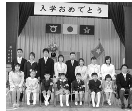
新入生と保護者、先生で記念撮影