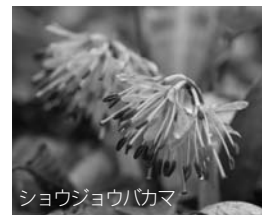
シヨウジョウカマ