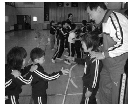
楽しく過ごした1年生を迎える会

なかよくしようね 四月十七日、一年生を迎える会が行われました。 二十四名の子どもたちが体育館に集まり、一年生にプレゼントを渡したり、みんなでゲームをしたりして、楽しい時を過ごしました。 ゲーム「じゃんけんれっしゃ」では、じゃんけんをしながら、どんな友達とつながって、最後に子どもたち全員のもとでも長い列車ができました。ゲームをしながら、上級生が下級生にやさしい言葉をかける姿も見られました。 一年生と上級生が、もつとなかよくなりました。