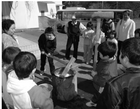
もちつきを楽しむ子どもたち

公民館事業「チャレンジスクール」第八講座および閉校式は二月二十五日、村公民館で行われました。