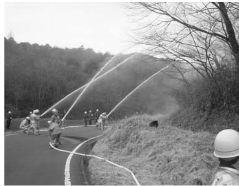
防備訓練を行う消防団員ら

平成十八年春季全国火災予防運動に伴う火災防備訓練は、三月五日、渡瀬字青生野(丸谷地)地内で行われました。