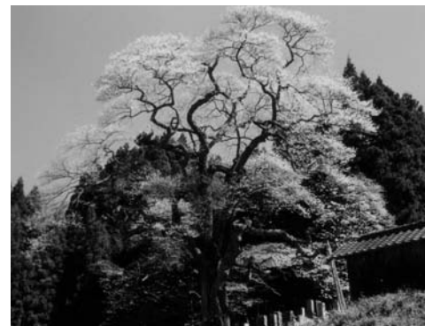
二段田のひがん桜 (西山字二段田)

天正10(1582)年に植えられたと伝えられ、樹齢400年を越えます。笠のように広がる枝ぶりの良さが評判で、毎年多くの方がその姿を映そうとカメラを手に訪れます。昨年からは開花時期にライトアップが行われています。