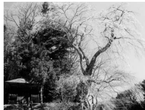
官沢の地蔵様のしだれ桜 (赤坂西野字官沢)

樹齢およそ350年。この場所に共同墓地がつくられた際に植えられたものと伝えられ、高さが30メートルにもなります。開花期には、空に向かうように広がった枝からピンクの花がこぼれんばかりに咲き誇ります。