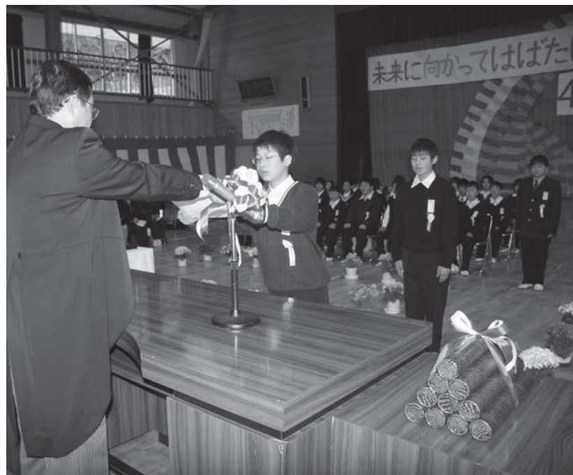
49人が巣立った鮫川小学校卒業式

村内小中学校の卒業式は鮫川中が三月十三日、青生野・鮫川両小学校では、同二十三日に各校体育館で行われました。