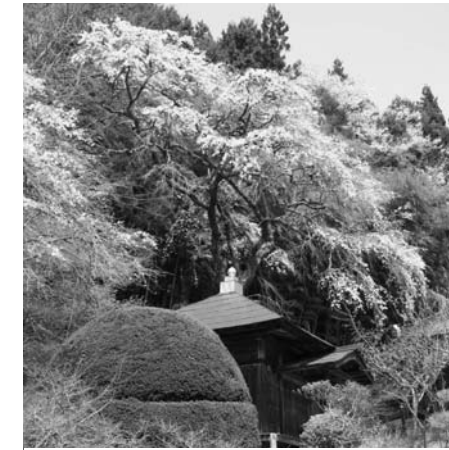
長遠寺のしだれ桜 (赤坂中野字伏木田)

樹齢およそ200年。小枝が多く、開花期には花と花が重なり合い、ピンクのカーテンのような美しさとなります。根元には、地蔵様を祀った小さな地蔵堂があります。