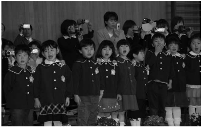
元気に園歌を歌う卒園児

幼稚園卒園式およびこどもセンター園歌のお披露目会は三月二十二日、同センターで行われました。