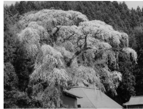
火打石のしだれ桜 (赤坂西野字火打石)

天正10(1582)年に植えられたと伝えられ、樹齢400年を越えます。笠のように広がる枝ぶりの良さが評判で、毎年多くの方がその姿を映そうとカメラを手に訪れます。昨年からは開花時期にライトアップが行われています。