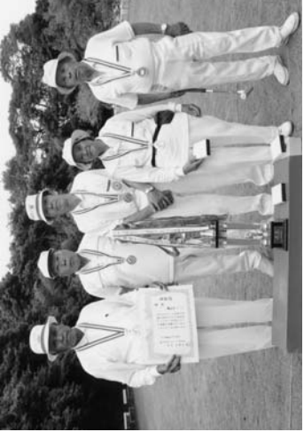
優勝した東野Dチーム

「第二十二回鮫川村老人クラブ連合会ゲートボール大会」は、八月五日、さきり荘ゲートボール場で開かれ、東野Dが熱戦を制しました。