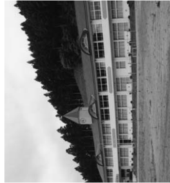
幼保一体化施設(旧西野小)

・ 相撲大会の振興策が何かないか。 ・ ゴミを投棄しにくい道路環境を整備できないか。毎週ゴミ拾いをしている人もいる。 ・ モデル地区で手打ちうどんをやっても構わないか。 ・ 東京鮫川会を通じた企業誘致ができないか。 ・ 柿や竹があるので、柿もぎやタ