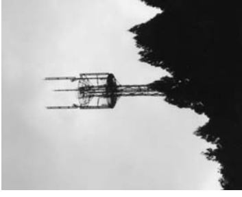
携帯電話アンテナ

・ 地域により植物は相違しているので、植物資源を発掘してはどうか。 ・ 鹿角平観光牧場で結婚式ができないか。 ・ 企業も労務管理上、心身のバラ