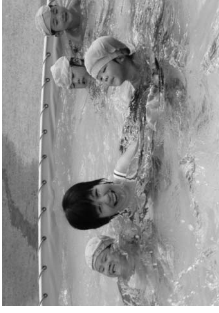
子どもたちとプールで遊ぶ保育士さん

私たち「子ども記者クラブ」は、鮫川保育所取材することになり、8月5日が開放日だったので、保育士さん、子育て中のお母さん、おばあちゃんにお話を聞きました。