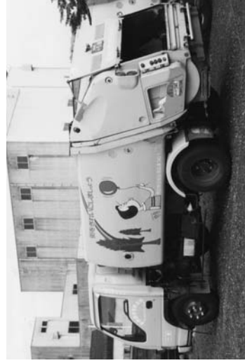
ごみが回収されるトラック

一日からゴミを家庭では燃やしてはいけないという法律ができました。もし、ゴミを燃やしてしまうと「三年以下の懲役もしくは罰金または三百万円以下の罰金」となります。