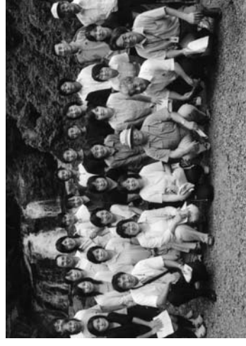
江竜田の滝の前で集合した参加者

村内の小中学校全教員を対象とした基礎学力向上実技研修会は八月十九日、村公民館で開かれ、三十名の先生が参加しました。