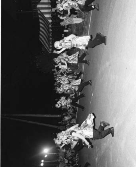
会場を盛り上げたよさこい踊り

赤坂中野区の「小童まつり」は八月八日、道少田地内の県道を歩行者天国として開かれ、子どもたちや家族連れなど大勢の人