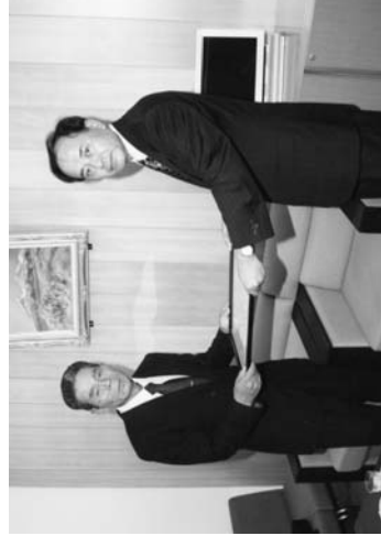
友部県南地方振興局長から大森渡瀬区長に手渡される感謝状

地方振興局長感謝状、知事感謝状の伝達式は七月二十八日、役場村長室で行われました。