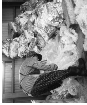
ごみを分別する人

家庭でゴミを燃やすことは禁止されています。なぜ禁止されているかというと、ゴミを燃やすことにより地球をかこんでいるオゾン層が破壊されてしまうからです。また、ゴミを燃やす時に出る煙には有害物質が含まれているため体に悪い影響をおよぼすからです。そのため、平成十三年四月