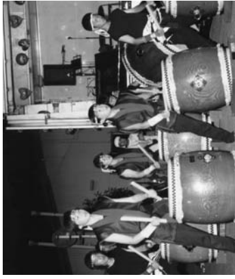
力強い太鼓の演奏

会場には、焼きそばやお好み焼き、かき氷などの露店が並び、家族連れや子どもたちでにぎわっていました。