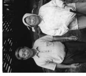
自宅脇の炭窯にて

現在は、子どもや孫たちとたまに行く温泉が楽しみだよ。無我夢中で働いてきた50年はあつという間だったけど、これからも自分の体に聞きながら、炭を作り続けていきたいね。