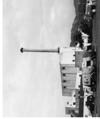
東白クリーンセンター

みんなにも、リサイクルできるゴミはきれいにしてから決めたゴミの袋に入れて出してほしいです。