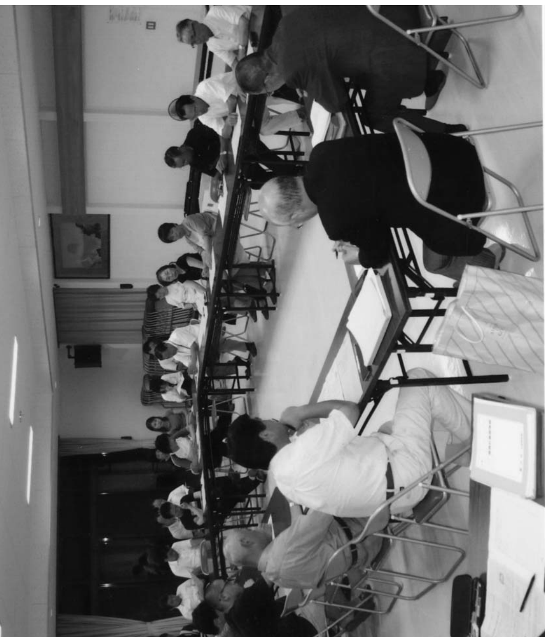
行政区懇談会 (7月22日 西野地区)