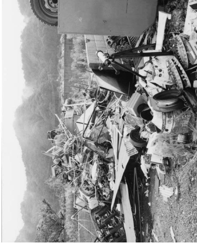
東白川郡で集められたガラクタ

私はゴミのことなど自分にはかんげいがないように思っていたんですが、ゴミは地球にとてもかんげいしていることがわかったので、これからもゴミはあまりださないようにどりよくしたいです。