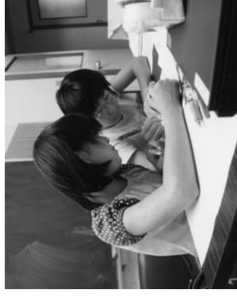
取材した内容をもとに記事を書く二人