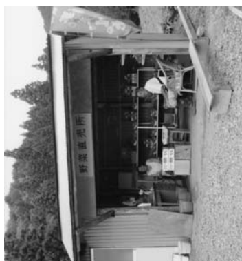
りんこの里江竜田直売所