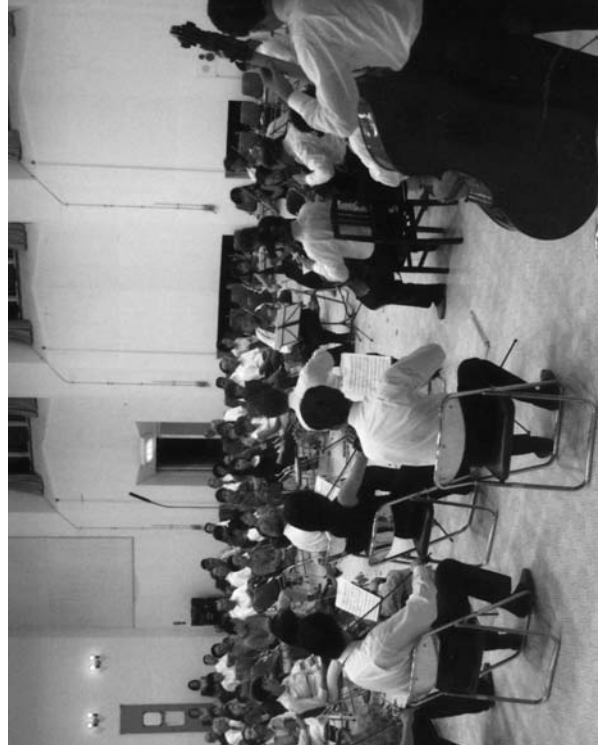
一流の演奏を堪能したコンサート

今回は、ベートホヴェンやシューベルトの弦楽四重奏曲、日本の歌メドレーなどが披露され、訪れた人たちは、鮫川村のために編成された室内楽を堪能しました。