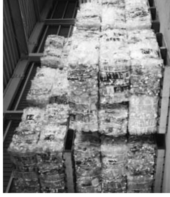
つぶされて山積みになったペットボトル

ゴミの中にも、リサイクルできる物があります。たとえば、ペットボトル・ハウスチロールなどがあります。でも、汚れたまま出すと燃やすことになってしまいます。中でも、ペットボトルを洗わないで(汚れたまま)出す人がいるのでリサイクルできなくなってしまう。リサイクルするためには、きちんと洗い、分別してゴミを出すことが大切です。リ