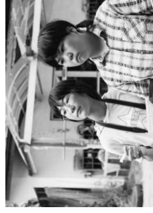
真剣な表情で取材する千聖さん、梓さん