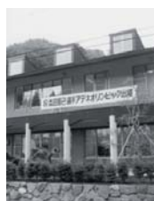
役場前に掲げられた応援幕