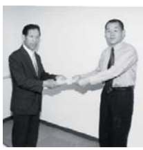
村長から阿久津会長へ手渡される大綱案