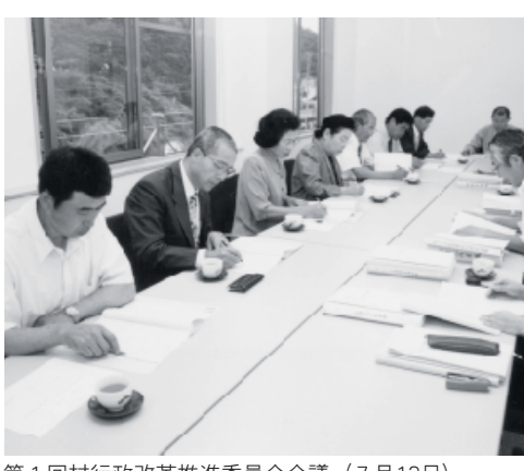
第1回村行政改革推進委員会会議 (7月13日)