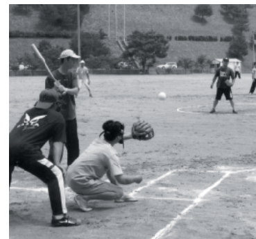
好試合が繰り広げられたソフトボール部門

村体育協会主催の「第五十九回健康づくり夏季球技大会」は、六月二十七日、青少年広場などで行われました。ソフトボール部門に二十一チーム、バレーボール部門に九チームが出場し、熱戦が繰り広げられました。成績は次のとおりです。【ソフトボール】▼青年：①西山ドットコム②西山2004③西野ボンバーズ▼壮年：①ザ・中野②西山球友③西野OB④中野ナイスエージ⑤西野OB⑥西山OB⑦シルバー⑧渡瀬シルバー⑨西山パワーズ【バレーボール】▼家庭：①青生野B②青生野A③渡瀬④九人制：①西山レディーズ②西野A③中野VBC