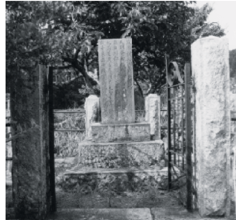
渡瀬区木之根地内にたたずむ「渡瀬村救荒修祭記碑」