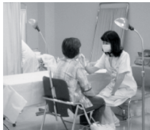
去年の健診から (口腔健診)